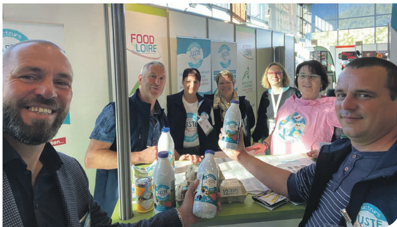
Les ambassadeurs ligériens et vendéens de la marque se sont rencontrés lors du salon Serbotel, à Nantes, cette semaine. p.28